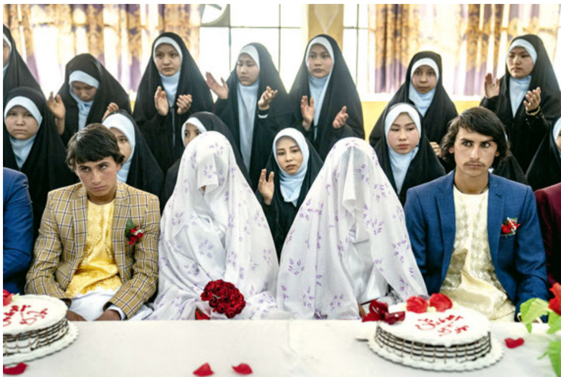
Masowa ceremonia zaślubin w Kabulu z okazji Międzynarodowego Dnia Kobiet.